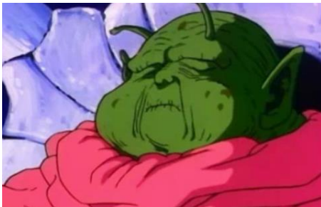
Nagy öreg Guru

Kisebb közösségekben élnek, amelyeknek egy vezetőjük van és a közösségeket egy nagy vezető köti össze, Nagy öreg Guru. Életmódjuk egyszerű, leginkább középkorinak leírható. Nincsenek nemek, aszexuálisak, tojással szaporodnak és a tojásokat a Guru rakta le.